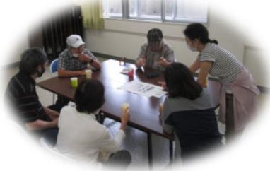
にしぽっぽカフェの様子

「地域包括支援センター」は、介護保険法に基づいて作られた、65歳以上の方のための相談・支援を行う機関です。市役所の委託で運営しています