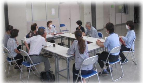
介護者交流会の様子

9/22（金） 介護者交流会&にしぽっぽカフェ 認知症の家族がいる方や、介護のお悩みを抱えている方同志で、お話しして頂きました。 柏西口包括では、交流会とカフェを定期的に開催しています。